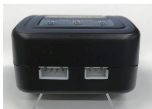
3セル用 2セル用 充電用バランスコネクター