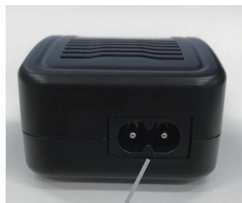
AC ケーブル接続ポート