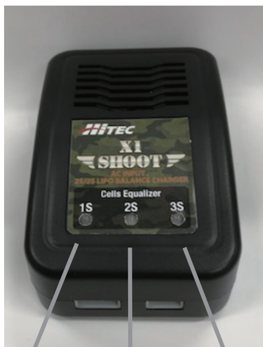
1S 2S 3S セル LED