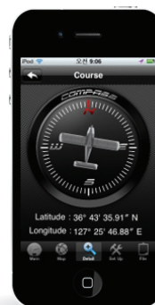
GPS View (緯度・経度)