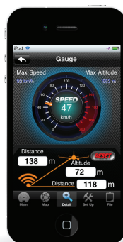
GPS View (速度・高度)